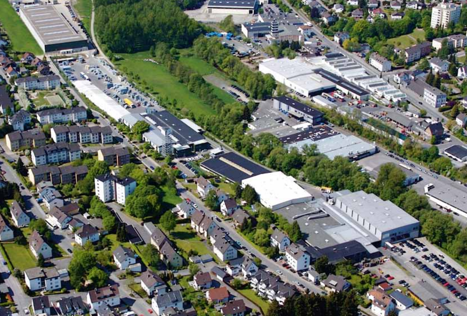
Firmengelände der JUNIOR Gruppe